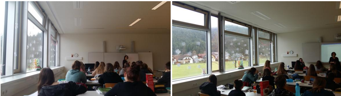
Abbildung 2: Fassade mit Lüftungsklappen im genutzten Saal