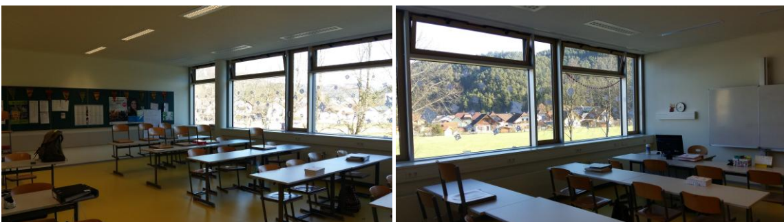
Abbildung 3: Fassade mit Lüftungsklappen im leeren Saal